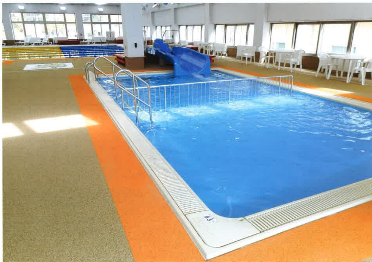
上/メインプール。コースロープにより6レーンに分かれ、うち1レーンは歩行運動等に用いられている 下/幼児用プール。水深50~70cmで滑り台が備えられている